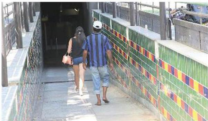
LA SICUREZZA Segnalati viavai nei sottopassi e nelle strade del quartiere, «purtroppo abbiamo avuto scippi e furti nelle case»