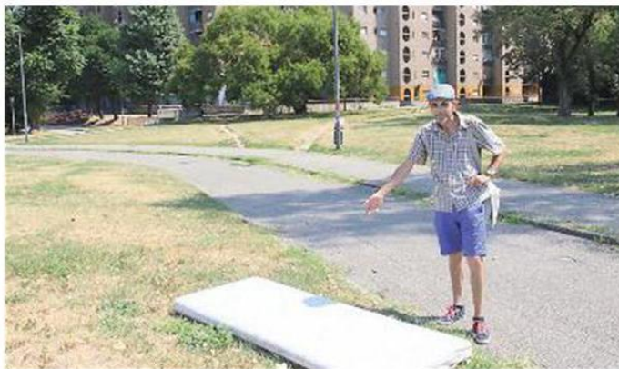
L'IMMONDIZIA Un materasso abbandonato nella striscia di verde tra le case e il metrò. «Ogni settimana troviamo di tutto»