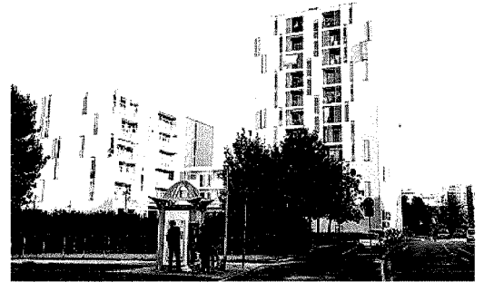
LE NOVITÀ Con le assegnazioni partiranno per gli inquilini i "servizi di accompagnamento": mediazione linguistica, animazione e aggregazione

Molti dei nuclei in attesa si appoggiano ora al residence sociale Aldo dice, ad amici e parenti. «Altrimenti sarebbero per strada. Servono tempi certi»