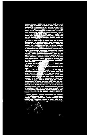
Manzoni cancellato da Isgrò