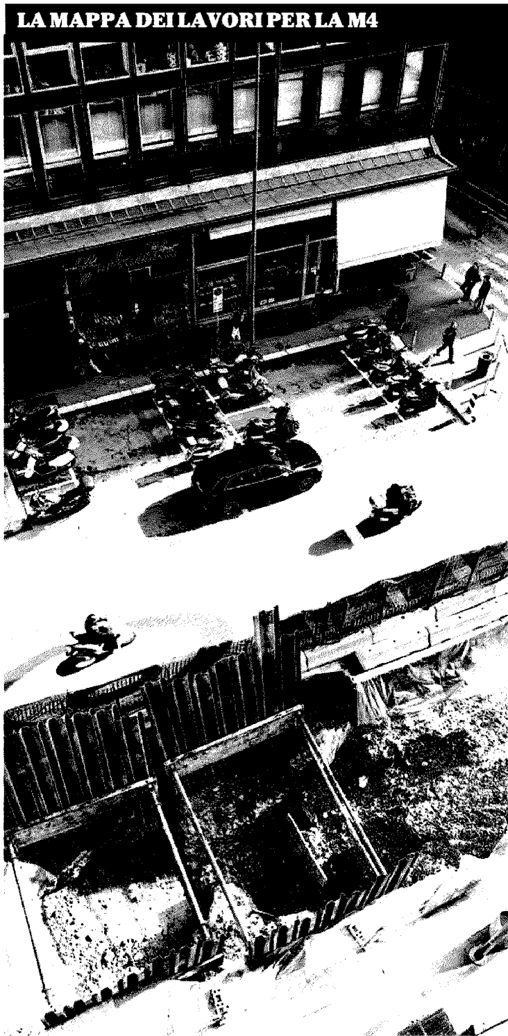
LA MAPPA DEI LAVORI PER LA M4