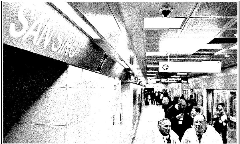
La fermata del nuovo capolinea di «San Siro stadio»

■■■ Da domani la linea M5 verrà arricchita da 5 nuove fermate: Domodossola, Lotto, Segesta, San Siro Ippodromo e San Siro Stadio. Ieri, durante il primo viaggio sulla tratta, l'assessore alla Mobilità Pierfrancesco Maran ha annunciato che, con questa apertura viene «confermato così il crono programma originario, consentendo di avere tutta la linea, dal Parco Nord allo stadio di San Siro, disponibile per Expo». «Un traguardo importante - come sottolineato da Maran - ottenuto grazie al grande spirito di collaborazione tra i soggetti impegnati in questo complesso ma strategico progetto infrastrutturale per Milano».