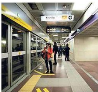
La stazione Zara della M5