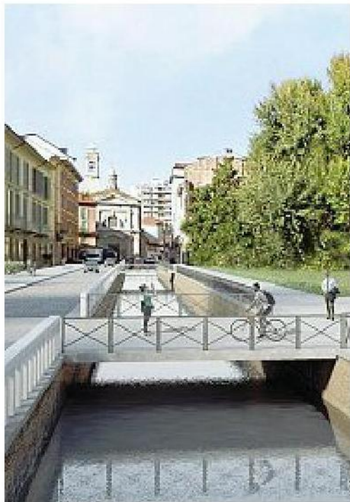
La «visione» Il Naviglio riscoperto in via Molino delle Armi