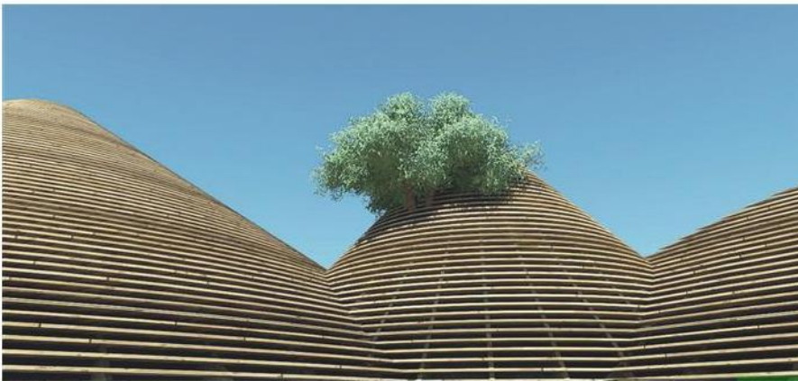
■ Il Padiglione Zero realizzato per l'Expo 2015 è tra i servizi acquisiti da Italferr per l'evento milanese

FONTE: Elaborazione di Guarnari su dati di bilancio (2016) delle società (valori in migliaia di euro)