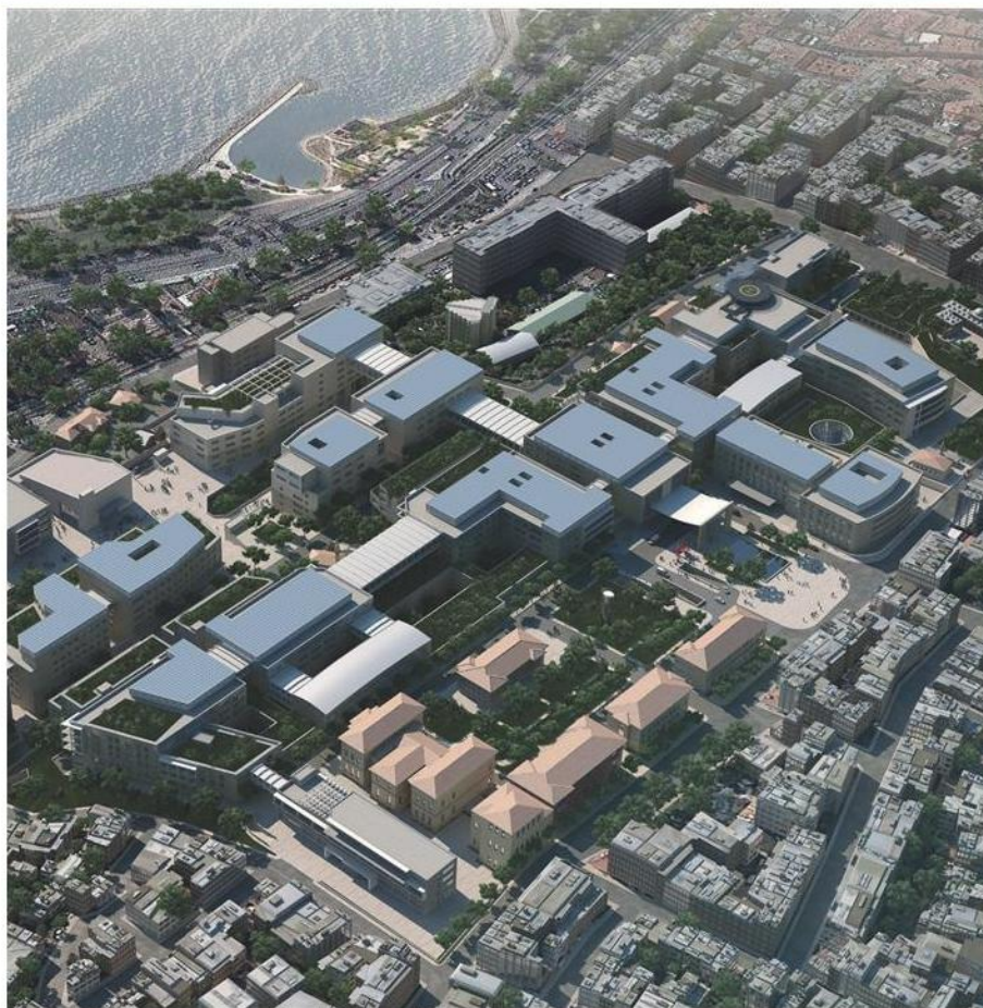
■ Render del Campus universitario e ospedale di Cerrahpasa a Instambul, una commessa di Proger