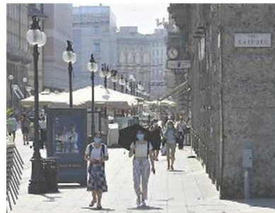
A spasso senza abbassare la guardia e la mascherina