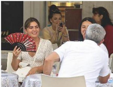
Una turista cerca sollievo al bar e sfoggia un ventaglio