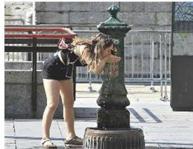
Corsa e code davanti alle storiche fontanelle della città