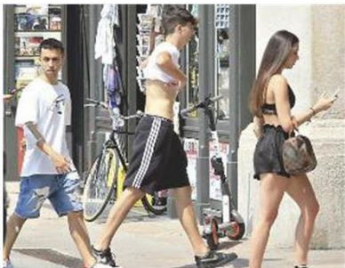
E anche i ragazzi si mettono il "top"