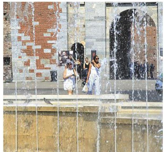
Fra le mete più ambite parco Sempione e le fontane del castello