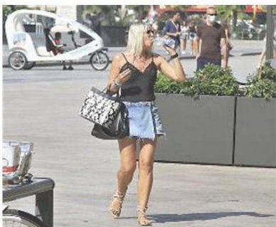
Shopping ma armati di bottiglie d'acqua