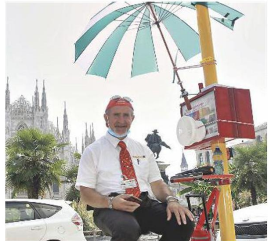
Il bigliettaio aspetta i turisti e resiste grazie a ventilatore e ombrello